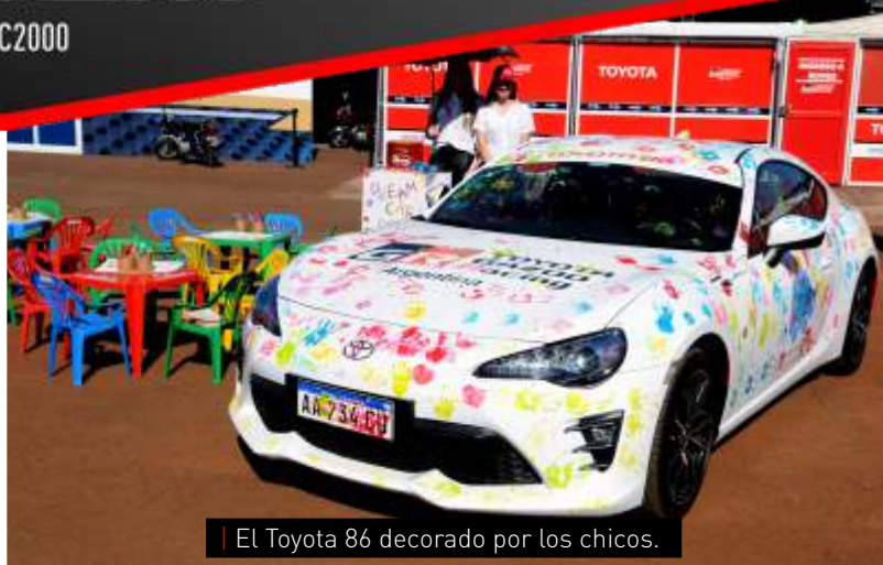
El Toyota 86 decorado por los chicos.