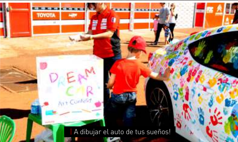
A dibujar el auto de tus sueños!