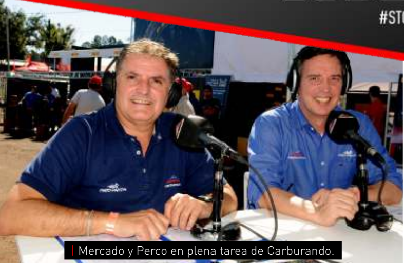
Mercedo y Perco en plena tarea de Carburando.