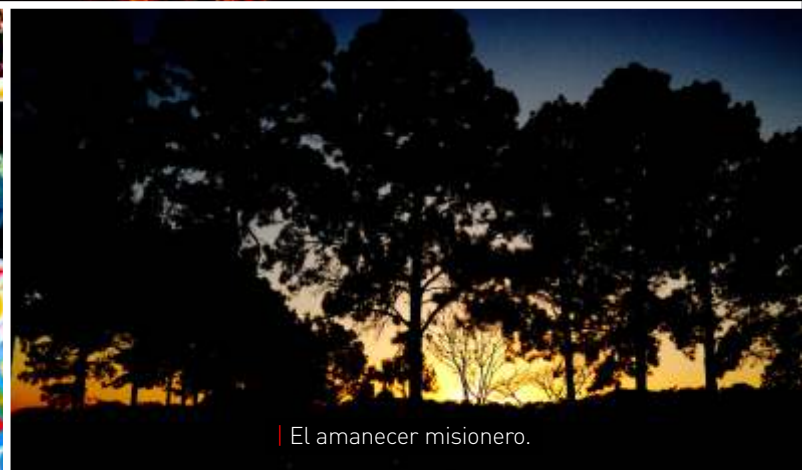
El amanecer misionero.