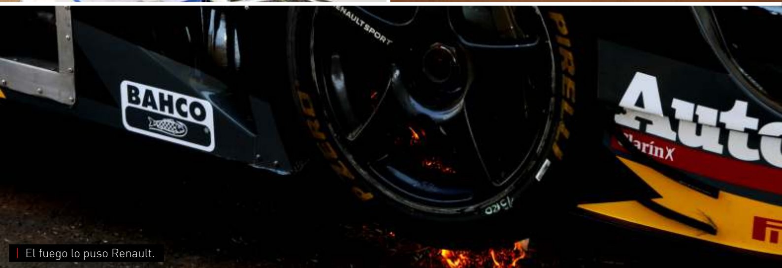
El fuego lo puso Renault.