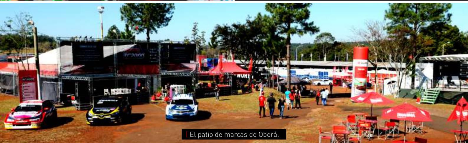
El patio de marcas de Oberá.